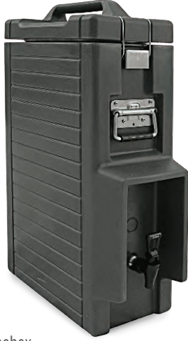
» İçecek Thermobox Beverage Thermobox