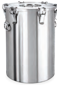
» İzoleli Double Wall Container