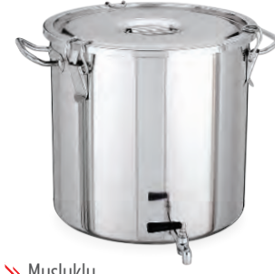
» Musluklu Container w/Faucet