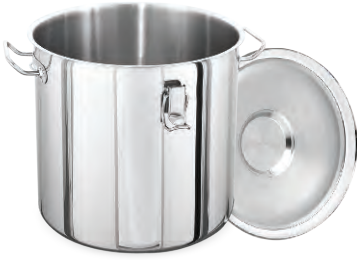
» Tabanlı (Silikon Conta Kapaklı) w/Sandwich Bottom-Lid w/Silicone Seal