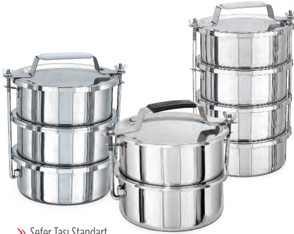
» Sefer Tası Standart Standard