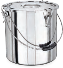
» Tabansız (Kapaklı) w/o Sandwich Bottom