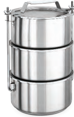
» Sefer Tası İzoleli Double Wall