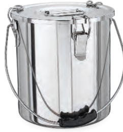
» Tabansız (Silikon Conta Kapaklı) w/o Sandwich Bottom-Lid w/Silicone Seal