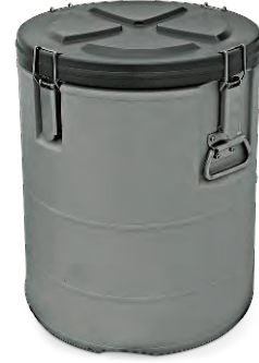
» Yiyecek & İçecek Thermobox Food & Beverage Thermobox