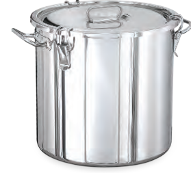
» Tabanlı (Kapaklı) w/Sandwich Bottom

* Ø36, Ø40, Ø45 ölçüleri sabit saplıdır * Ø36, Ø40, Ø45 has fixed handles