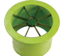
Doğrayıcı (Göbek Çıkarıcı) Corer Segmenter