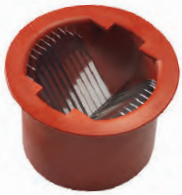
Dilimleyici Semi-Circle Slicer