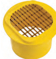
Patates Dilimleyici French Fries Cutter