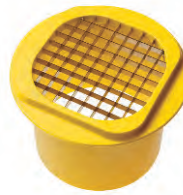
Patates Dilimleyici French Fries Cutter